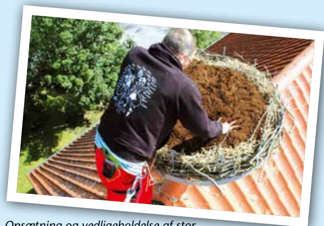
Opsætning og vedligeholdelse af storkereder er et af de formål du støtter gennem Storkene.dk

Vi fører som nævnt en utrættelig kamp og bruger ganske mange timer på arbejdet for Danmarks gamle nationale symbol storken. Men alene og uden støtte klarer vi det ikke. Derfor opfordrer vi dig til at melde dig ind i Storkene.dk og dermed støtte vores kamp.