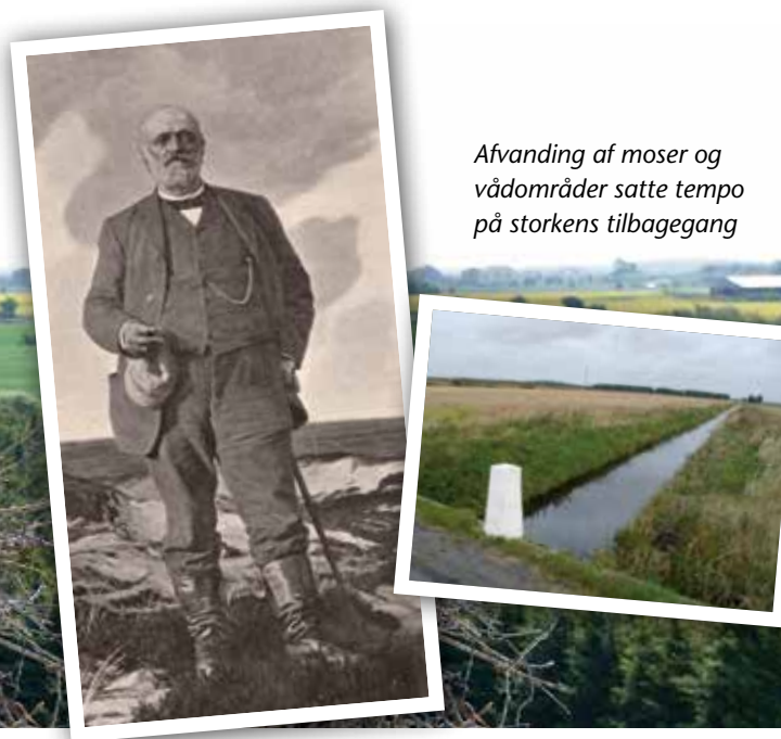
Afvanding af moser og vådområder satte tempo på storkens tilbagegang

Storkene.dk er en landsdækkende interesseforening for den hvide stork, der blev grundlagt i 2007 af en gruppe storkeentusiaster. Hos Storkene.dk har vi alle det tilfælles, at vi føler at storken og dens leveområder har brug for den allerstørste opmærksomhed.