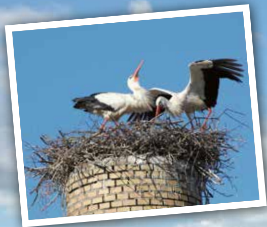
Storkeparret Ida og Emil på deres skorstensrede i Gundsøllille.